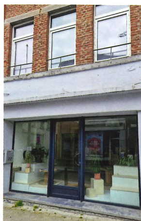
Léopold, commerce partagé

Dans le bulletin communal de mars, nous vous parlions du projet CLAP GEMBLoux et du concept qui verra le jour d'ici septembre : Léopold - commerce partagé.